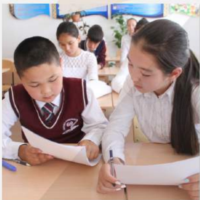
«Давай сначала прочитаем критерии, чтобы узнать, что от нас требуется»