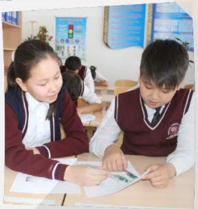
«Мне трудно выполнить задание по данному критерию»

Вот так мы учимся каждый день. Мы работаем в парах, группах, индивидуально. Мы часто оцениваем свою работу и работу своих одноклассников, а учитель нам помогает.