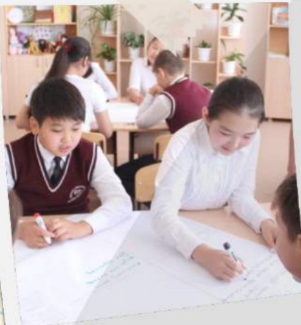
«Все согласны? Мы вместе должны принять решение»