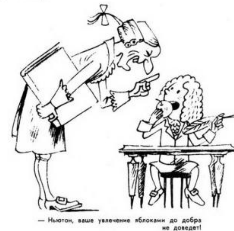
— Ньютон, ваше увлечение блоками до добра не доведет!