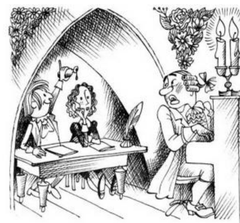
— Моцарт, послушайте меня, переждите от Сальери!