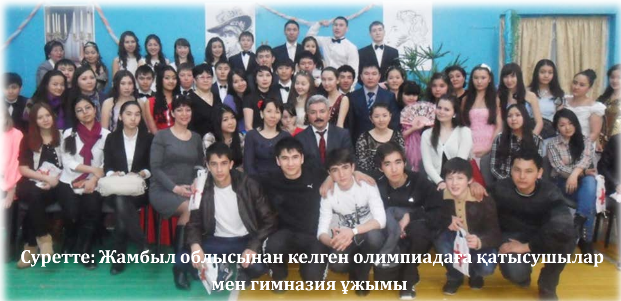
Суретте: Жамбыл облысынан келген олимпиадаға қатысушылар мен гимназия ұжымы

29 күні гимназия ұжымы бақ сынасуға келген оқушыларға «Ұлттың ұлылығы-рухты ұрпағында» атты концерт қойып, естелік ретінде сыйлықтар ұсынды. Концерттен кейін гимназия мұражайын аралатып, мектеп тарихымен таныстырды. Орыс тілі кафедрасының ұйымдастыруымен «Әдебиет кейіпкерлерінің балын» тамашалатты. Келген қонақтар оқушыларға алғыстарын айтып, ризашылығын білдірді. Гимназия әкімшілігі қонақтардың басы қасында болып, қаланы қыдыртып, шығарып салды.