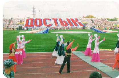
Қарағандыға Елбасы келгенде «Шахтер» стадионы 2005 жыл