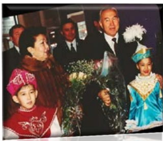
«Шолпан» Н.Ә.Назарбаев Сара Алпысқызымен

1993 ЖЫЛЫ АЛҒАШ «ШОЛПАН БИ» АНСАМБЛІ ҚҰРЫЛДЫ